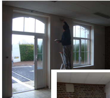
Isolation de la petite salle et confection d'un rangement