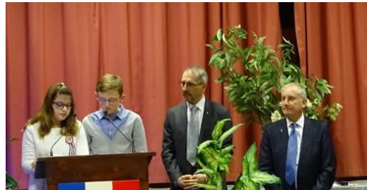
Le discours poignant du CEM... et celui du Maire