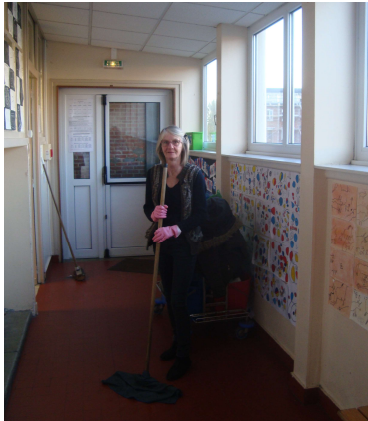
Nettoyage des locaux de l'école