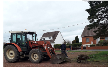
Entretien de la Place des Sorbiers